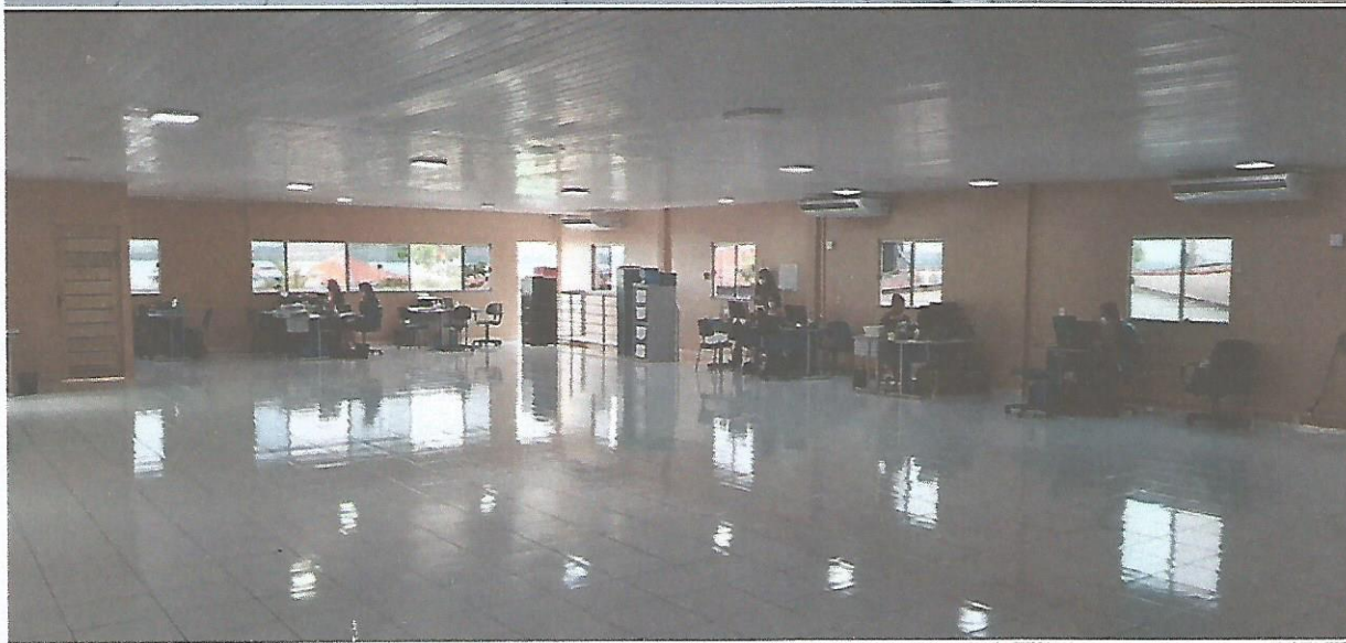
Foto do salão.