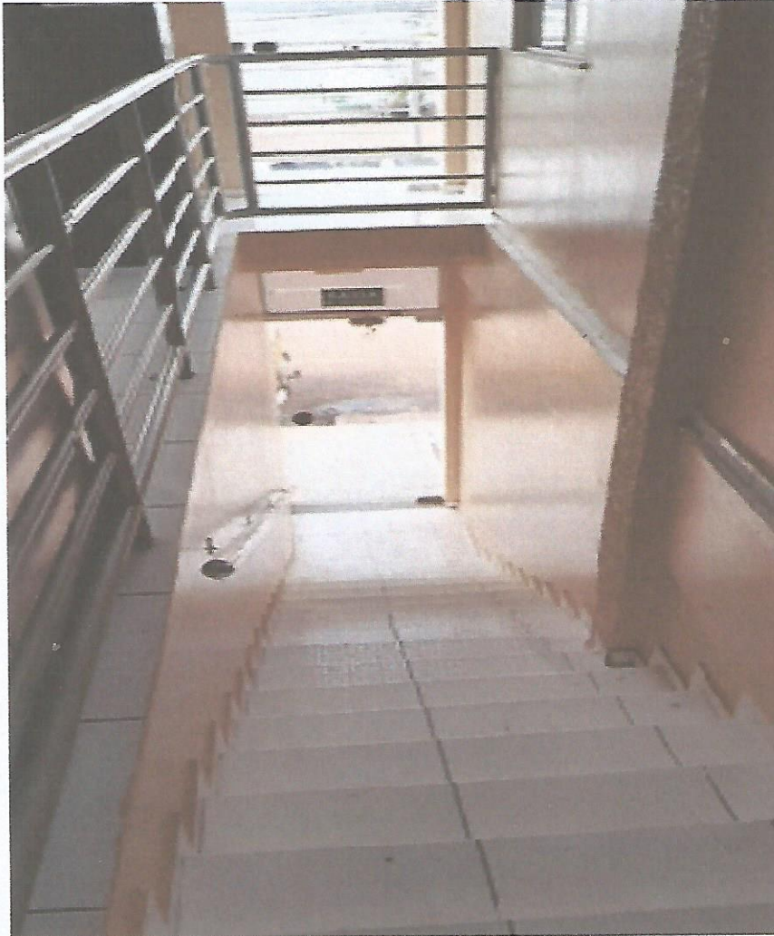
Foto – Escada