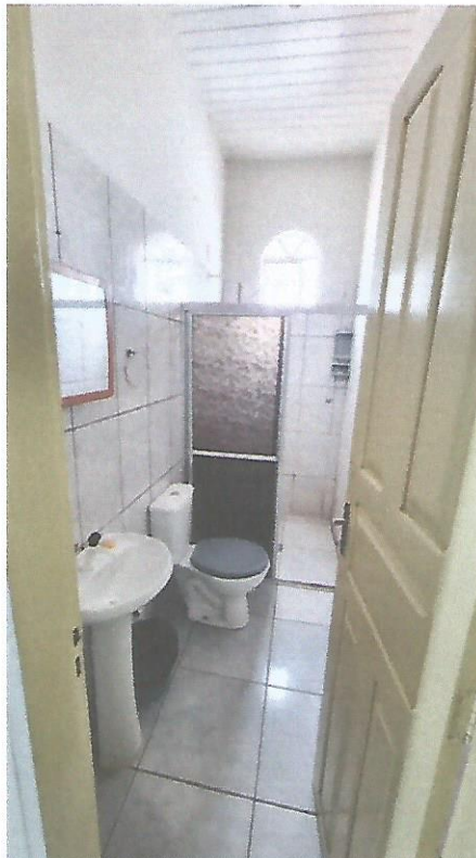
Foto: Banheiro do Salão