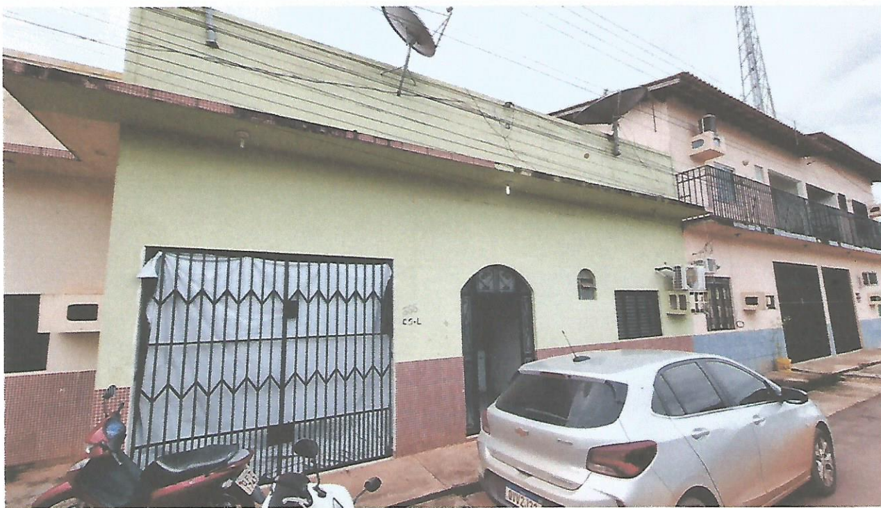
Foto: Frente do Imóvel